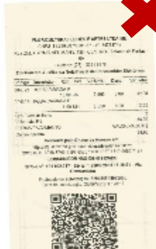
204 E-mail: 73 2616 3300