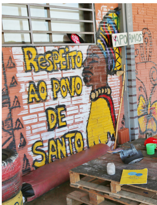
[Imagem 2] Pavilhão de aulas - CJA