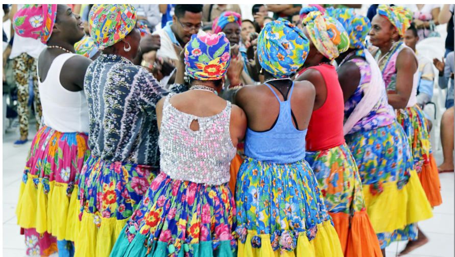
[Imagem 6] (à esquerda) Apresentação cultural no Fórum CPF