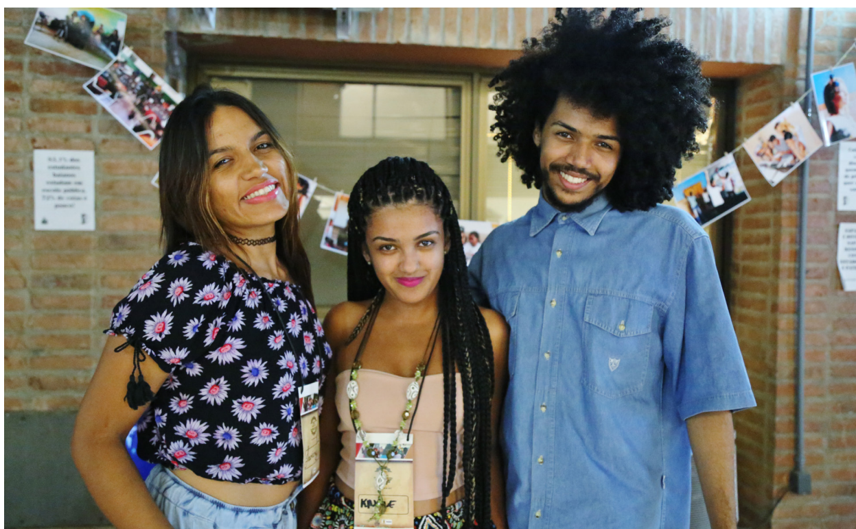
[Imagem 1] Estudantes da UFSB no Fórum Juventude Viva - CJA