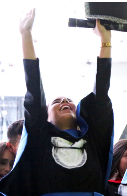
[Imagem 4] 1ª Formatura da UFSB do primeiro ciclo, em 2018 / Foto: ACS.