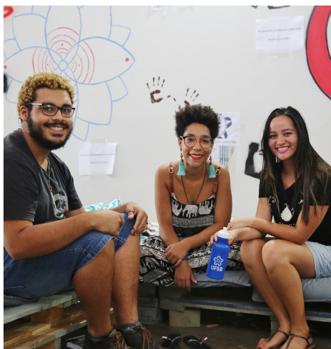
[Imagem 3] Estudantes da UFSB