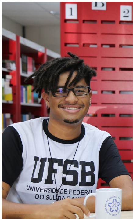
[Imagem 1] Estudante da UFSB

A Universidade Federal do Sul da Bahia, criada pela Lei n. 12.818, de 05 de junho de 2013, é uma Instituição de Ensino Superior com autonomia didático-científica, administrativa, patrimonial e financeira, nos termos da Constituição Brasileira. A autonomia universitária, compreendida como exercício de autonormatividade, autogestão e corresponsabilidade social e institucional, concretiza-se na plena liberdade de criação, pesquisa, extensão e ensino-aprendizagem.