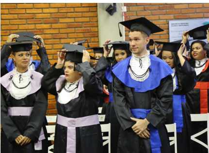
[Imagem 5] 1ª Formatura da UFSB do primeiro ciclo, em 2018

vagas disponíveis aos/às candidatos/as interessados/as em ingressar na UFSB, sendo escolhida a maior nota.