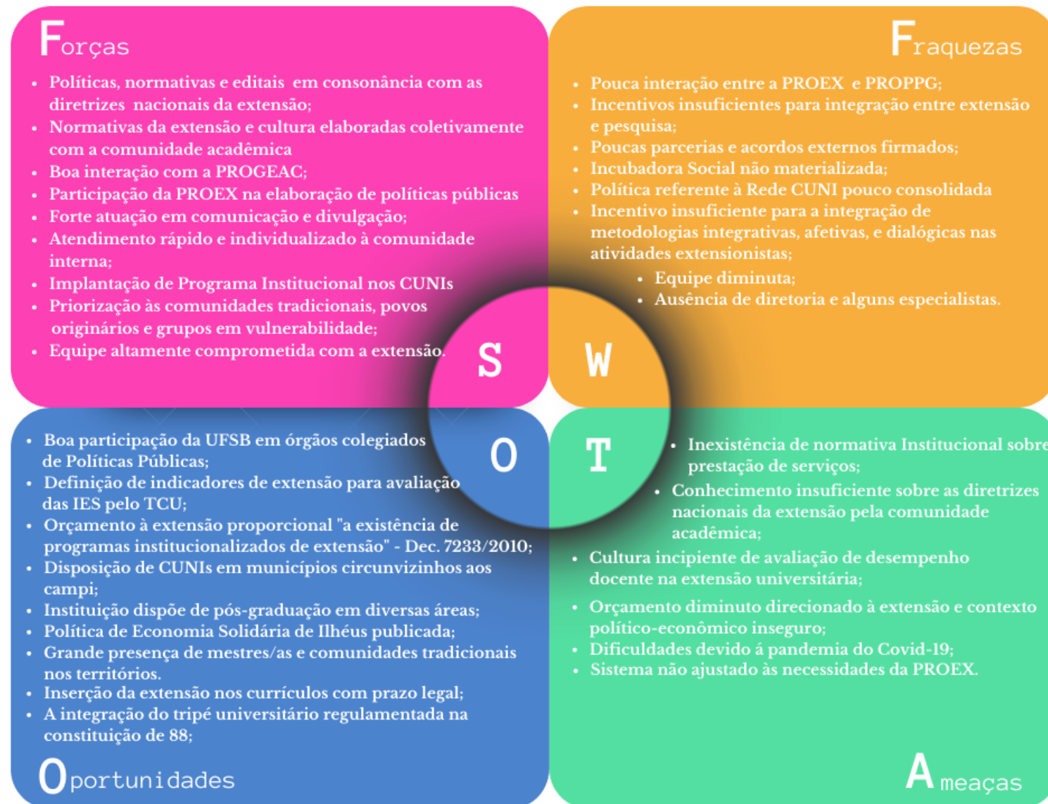
Figura 3 – Matriz FOFA da Proex - 2022.

Com o intuito de melhorar a percepção sobre os desafios e esforços empreendidos pela Proex para concretizar seus objetivos e resultados, e ainda construir uma visão mais clara e integrada do contexto de atuação, a equipe da Proex realizou o diagnóstico através da ferramenta matriz FOFA (Forças, Oportunidades, Fraquezas e Ameaças) ou, em inglês, análise SWOT (Strengths, Weaknesses, Opportunities and Threats). Sintetizado na Fig. 3 .