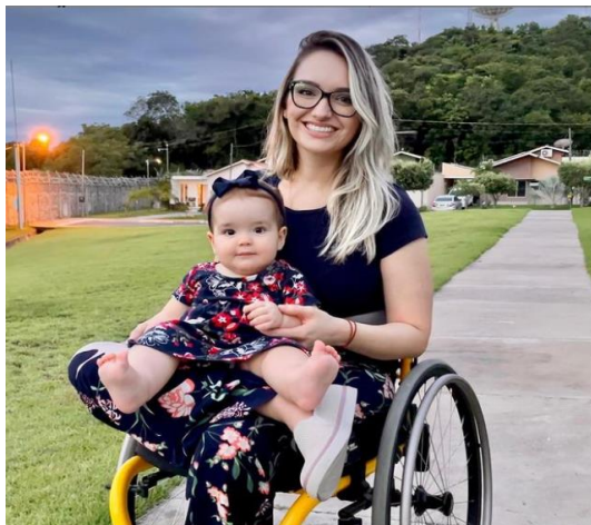
Figura 2 – Mãe com deficiência física com bebê no colo.