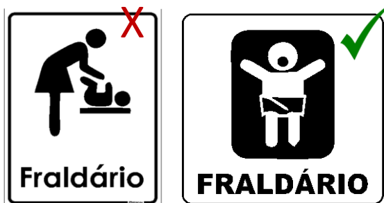
Figura 6 – Símbolos representativos para identificação de fraldários.