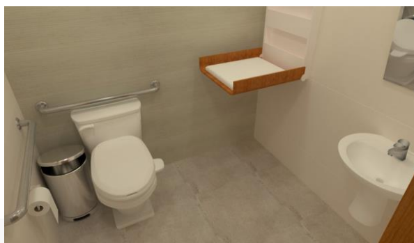
Figura 5 – Banheiro para PCD com fraldário retrátil.