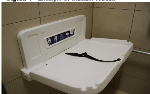
Figura 4 – Exemplo de fraldário retrátil.