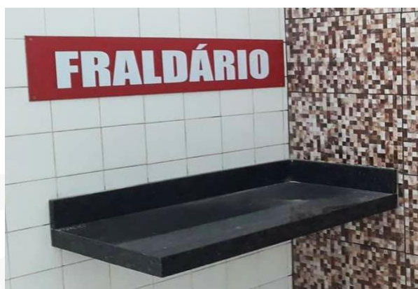
Figura 3 - Exemplo de pedra de granito instalada para ser utilizada como fraldário.