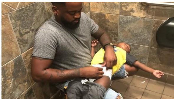
Figura 1 - Pai agachado trocando fralda de filho devido a inexistência de trocador no banheiro masculino.

É preciso considerar que, nos tempos modernos, diversas formas de família têm surgido e, diante do contínuo aperfeiçoamento da sociedade, é necessário avançarmos na luta pela desconstrução da hierarquia entre os gêneros. Portanto, considerando a dificuldade que os pais ainda enfrentam para encontrar locais adequados para a troca de fraldas quando saem sozinhos com seus bebês (Figura 1) e, pensando em minimizar a desigualdade da carga de atribuições no exercício da maternidade e paternidade, os fraldários da UFSB deverão ser instalados em pontos acessíveis a ambos os sexos. Trata-se de proposta que incita o desejo de uma sociedade mais igualitária no que diz respeito às divisões equitativas dos cuidados com os filhos.