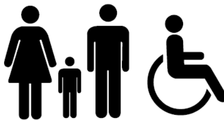
Figura 7 – Símbolo representativo do Banheiro familiar acessível.