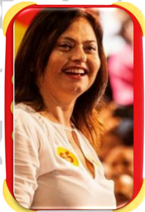
Alice Portugal (Deputada Federal)

O PROGRAMA FUTURE-SE E O TRABALHO DOCENTE: ENSINO, PESQUISA E EXTENSÃO