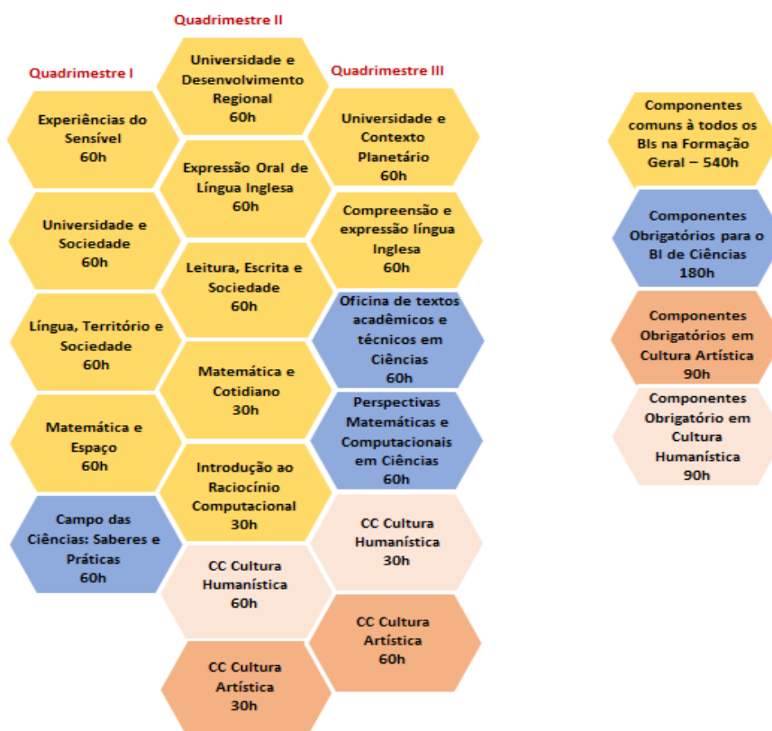
Figura 2: Matriz Formação Geral BI Ciências

A) Formação Geral correspondendo aos três primeiros quadrimestres do curso –, comum a todos os BIs, destina-se à aquisição de competências e habilidades que permitam compreensão pertinente e crítica da complexa realidade regional, nacional e global. Esta etapa tem carga horária mínima de 900 horas ou 60 créditos.