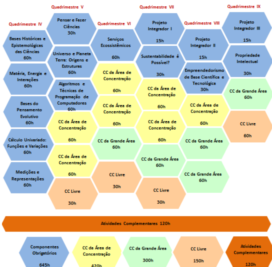
Figura 3: matriz curricular da formação específica do BI-Ciências (anos 2 e 3).

Abaixo estão descritos os CCs obrigatórios da Formação Específica e o CCs optativos das três áreas de concentração.